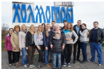
Автобусная экскурсия «Древняя земля холмогорская» 18.09.2015