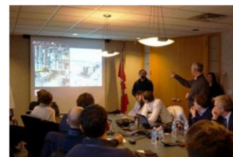
ООО «Велесстрой» Красноярского края Эвенкийского района.