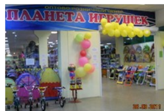
Отдел «Планета игрушек»