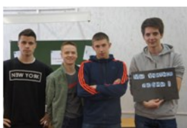
Посвящение в студенты. 12.10.2015