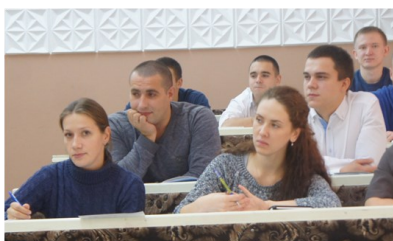
Семинар по психологии у сту- дентов 1 курса 30. 07.10.2015