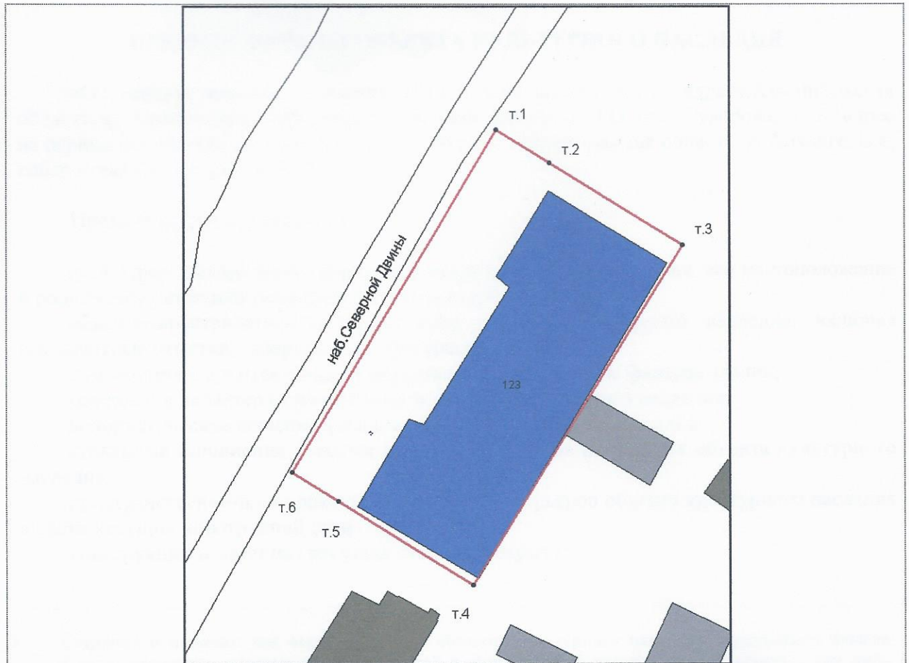
Каталог координат поворотных точек границы территории объекта культурного наследия «Ольгинская женская гимназия»

Система координат – местная г. Архангельск.